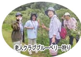
老人クラブブルーベリー狩り