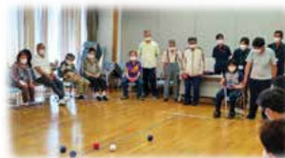
（障がい者関係）健康づくり・集い