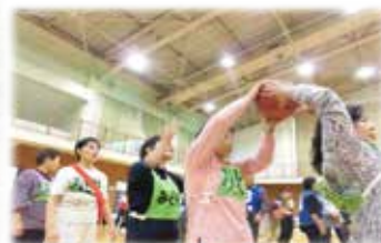
（高齢者関係） 健康づくり事業