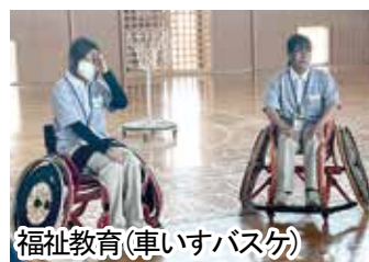
福祉教育(車いすバスケ)