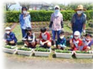
（児童・青少年） 花いっぱい運動ほか